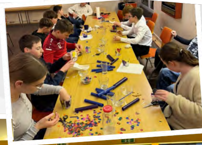
Konfi- kurs KK27