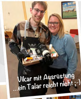
Vikar mit Ausrüstung ...ein Talar reicht nicht ;-)